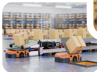
▼ 自律移動ロボット (AMR)