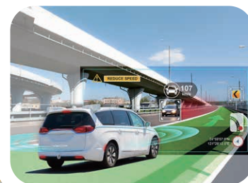
△ 車載コンピューティング